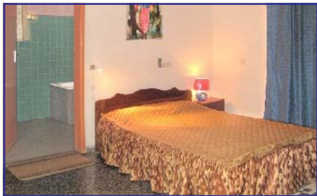
Chambre tout confort