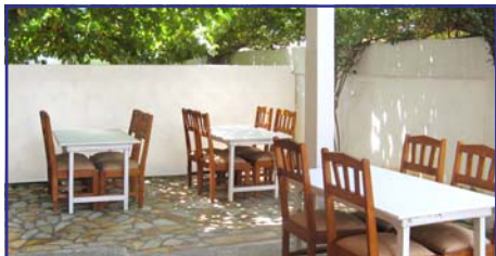
Terrasse ombragée sous la treille