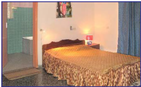
Tout confort et Wi-fi